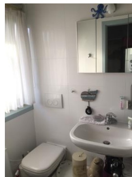
Bad / WC